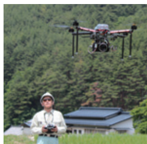
高精度の空中写真測量