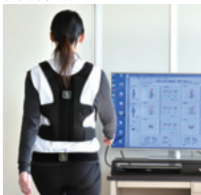
歩行解析に特化した体幹2点歩行動揺計