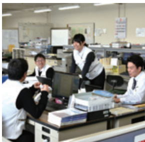
若手社員が活躍しています