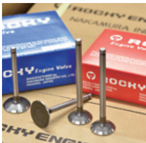
世界中で使用される補修用エンジンバルブ