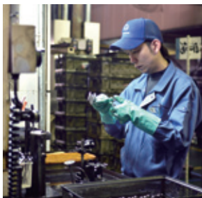
エンジンバルブ加工の様子