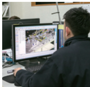
設計・開発の様子