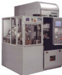
研削盤ローディング装置