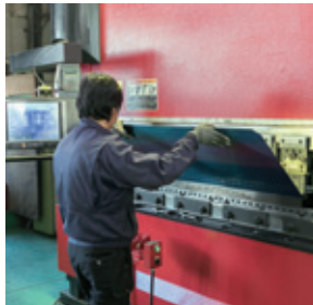
お客様のニーズに柔軟に対応する現場