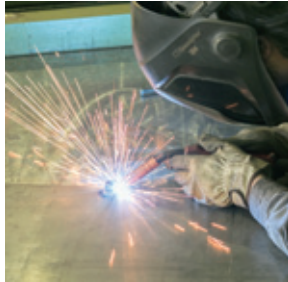
精密な加工技術が当社の強み

また技術面では、現場技術者全員が工場板金技能士の資格を有し(特急1名、1級4名、2級2名)、業界内でも対応できる会社が少ない比較的大きな製品や溶接を多く手がけています。