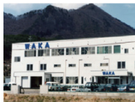
国内外の拠点から、WAKAブランドを発信