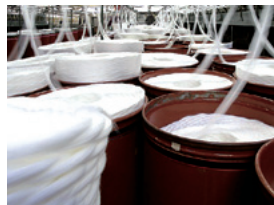
一貫した国内製造が高品質を生み出す